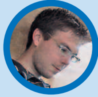
DER ANALYST „Wenn es logisch ist, ist es richtig!“