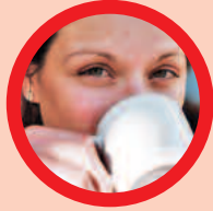
DER KOMMUNIKATOR „Lass uns darüber reden!“