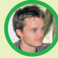
DER VERWALTER „Vorsicht!“