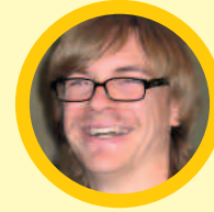
DER SCHÖPFER „Wiederhole nichts, was Du schon kannst!“